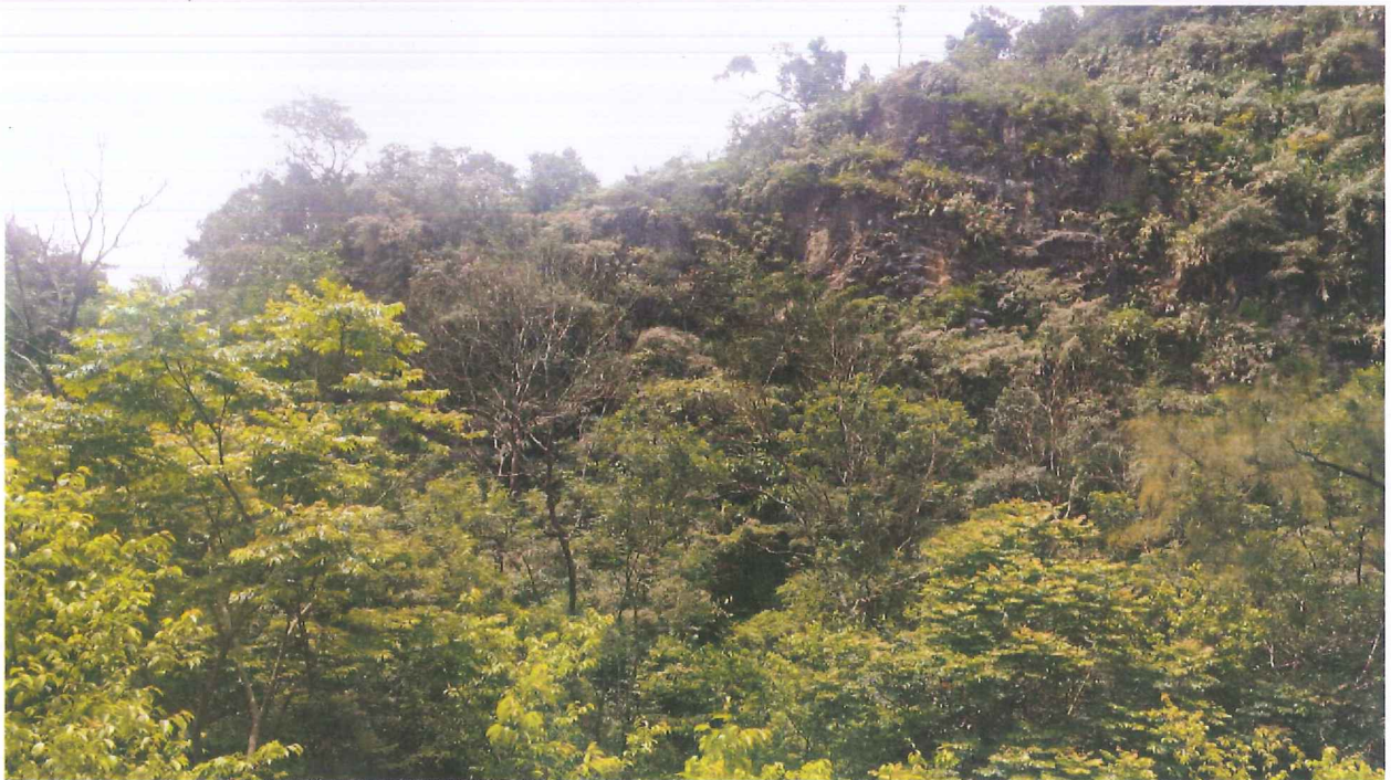
礦場採掘面植生復育現況照片