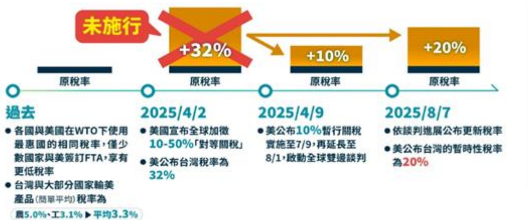
圖 1 美國對等關稅稅率動態變化一覽表